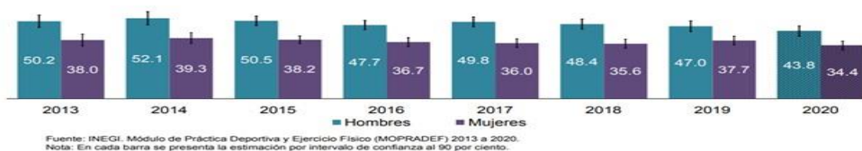
Porcentaje de la población de 18 y más años de edad activa físicamente, por sexo Serie 2013 a 2020

Se mantiene el comportamiento en cuanto a que los hombres lo realizan en mayor proporción que las mujeres (43.8% y 34.4% respectivamente).